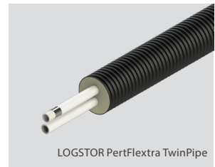
LOGSTOR PertFlextra TwinPipe