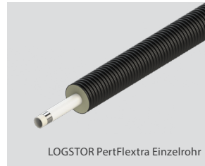
LOGSTOR PertFlextra Einzelrohr

Abmessungen des Mediumrohrs: 25 – 63 mm, Abmessung des Mantelrohrs: 90 – 180 mm.